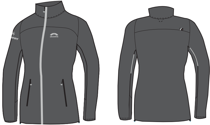
3008 VENTO Staufen Damen Jacke 3007