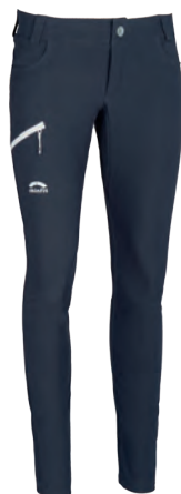
6030 | INFINITO SOHO DAMEN HOSE