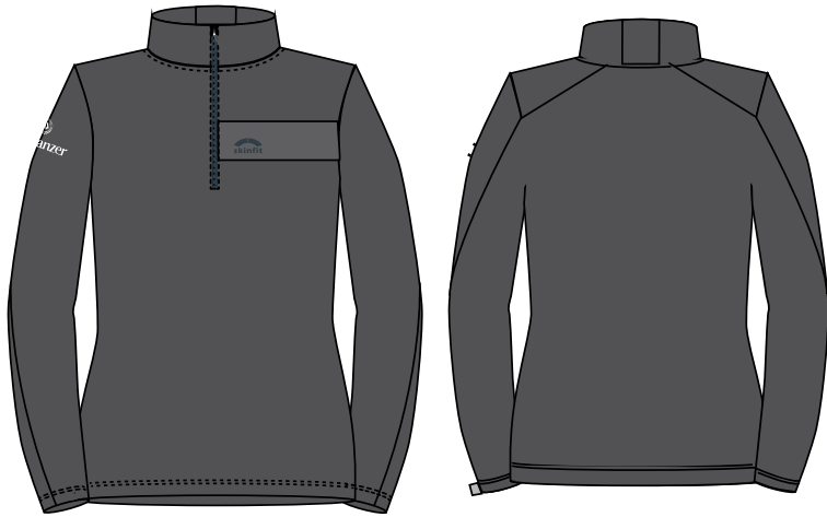
2002 AERO Mathon Shirt