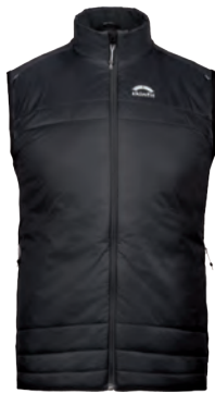
3602 | CALDO | CRISTALLO WESTE