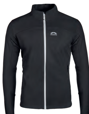
3007 | VENTO | STAUFEN JACKE