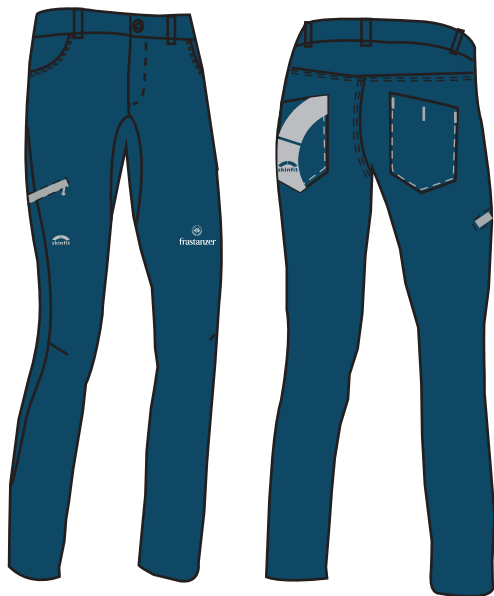
6030 Infinito Soho Damen Hose