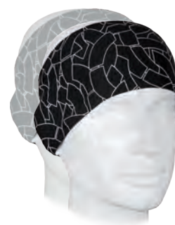
8017 | PALÜ STIRNBAND