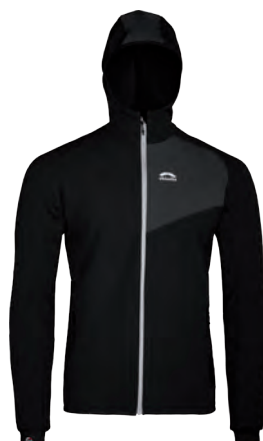
2602 | VENTO | BERNINA JACKE

Stoff 1: 91% Polyester, 9% Elastane Stoff 2: 89% Polyamide, 11% Elastane Größen: XXS / XS / S / M / L Farbe: schwarz Preis: € 111,75 (statt € 149,-)