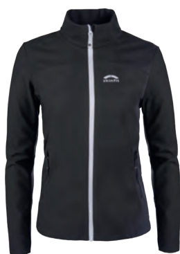
3008 | VENTO | STAUFEN DAMEN JACKE