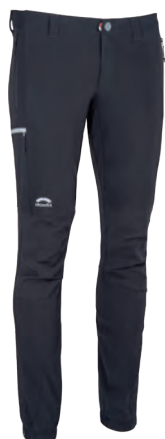
2905 | VENTO | MONTE ROSA HOSE