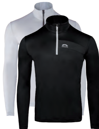
2002 | AERO | MATHON SHIRT

Stoff 1: 100% Polyamide Stoff 2: 89% Polyamide, 11% Elastane Wattierung: 100% Polyester (100g) Futter: 100% Polyamide Größen: XS / S / M / L / XL / XXL Farbe: schwarz Preis: € 111,75 (statt € 149,-)