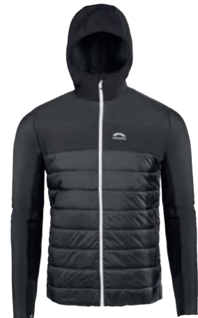
3641 | CALDO | VALCANOVA JACKE

Stoff 1: 95% Polyester, 5% Elastane Größen schwarz: XXS / XS / S / M / L / XL Größen grau: XXS / XS / S / M / L / XL / XXL Preis: € 85,50 (statt € 114,-)