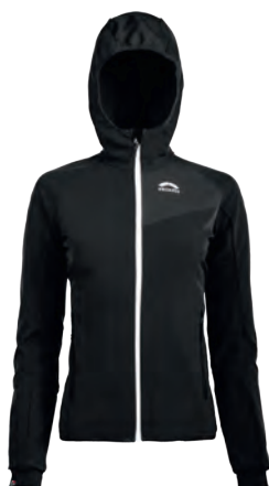
2351 | VENTO | BERNINA DAMEN JACKE