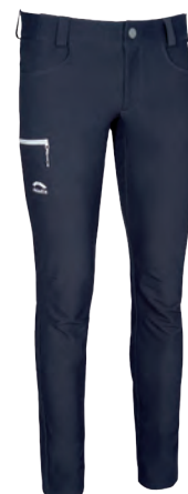
6057 | INFINITO SOHO HOSE