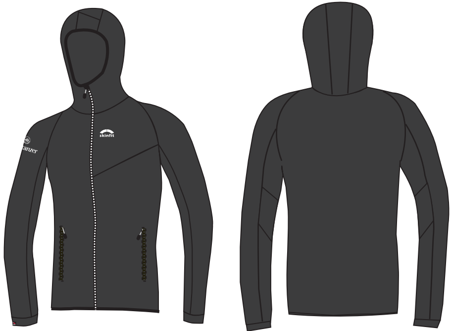
2602 VENTO Bernina Jacke 2351